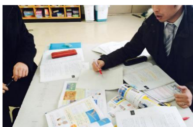
同じ単元でも、教科書を比較すると扱いが違っていました。