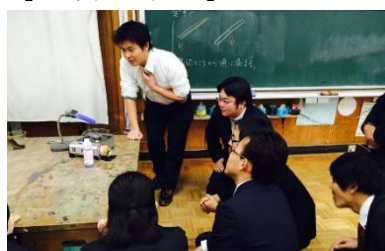
実際に、実験をしながら教材研究を行いました。