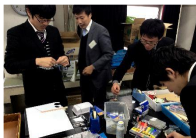
授業で使う教材づくりをしました。