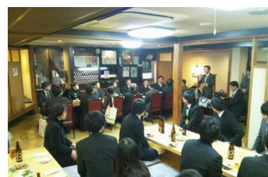
初日が終わった後の懇親会では全国の仲間と交流しました。